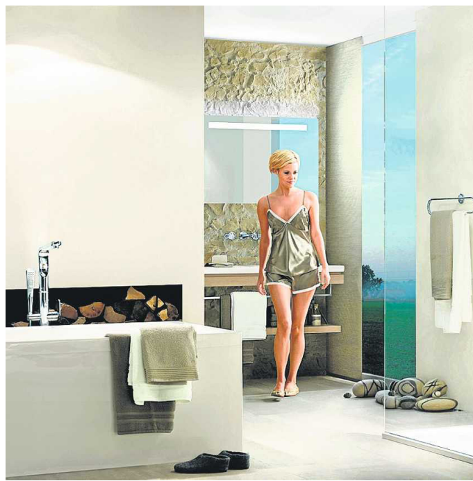
Ips/Kk. Die richtigen Armaturen tragen viel zur Badgestaltung bei.