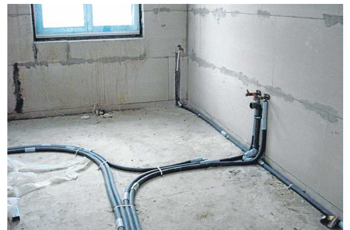
Ips/Cb. Vorbereitung für die Fußbodenheizung

Damit Fußbodenheizungen optimale Ergebnisse bringen, sollte deren Einbau schon mit dem Architekten im Zusammenwirken mit einem Heizungsbauer geplant werden. Fußbodenheizungen lassen sich am besten mit Fliesen- oder anderen Plattenbelägen kombinieren. Fliesen sind gute Wärmeleiter, was wiederum Energie einspart. Parkett, Dielen, Laminat, PVC und Linoleum eignen sich, wenn das Material für die Kombination mit einer Fußbodenheizung zugelassen ist. Neben warmwassergebundene Heizsystemen kommen auch elektrisch betriebene Heizungen zum Einsatz. Dafür werden Widerstandskabel oder Folien mit eingearbeiteten Heizleitern unter, im oder auf dem Estrich verlegt.