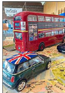
„Kleiner Maßstab, große Faszination“, so das Motto der 10. Modellbauausstellung in Neuhaus.