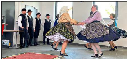
Ungarischer Volkstanz wurde im Neuhauser Feuerwehrhaus aufgeführt.