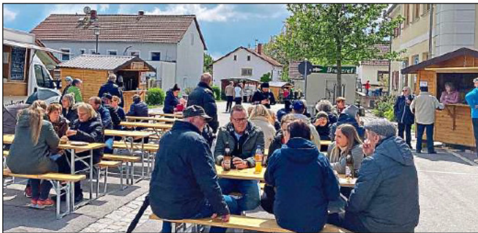
Weg mit dem Graupel: Im Verlauf des Tages zeigte sich dann doch noch die Sonne beim Frühlingsmarkt rund ums Neuhauser Rathaus.

Derweil fand im Vornbacher Weg in Neuhaus der Tag der offenen Tür in der Kläranlage statt, die heuer 30 Jahre alt wird. Informationen zur Abwasser- und Klärschlammungsorgung sowie Details zu Schadstoffen und Wassermengen bot engagiert Klärwärter Josef Schwarz den interessierten Besuchern. Er erlaubte einen Blick hinter die Kulissen der Einrichtung und erklärte Abläufe, Zusammenhänge sowie technische Daten. Nachhaltig: In der Schänke zum Schwarzen Schaf fand am Sonntag übrigens eine Tauschbörse für Pflanzen, Kleider und Bücher statt.